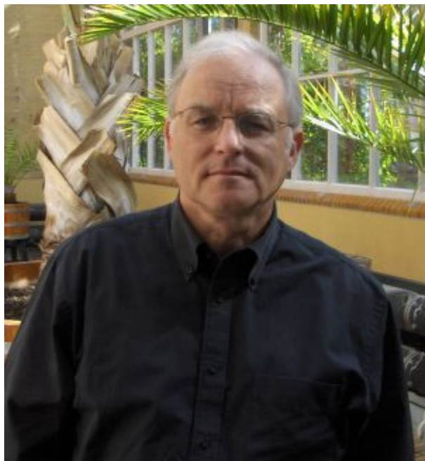
Richard Louv.