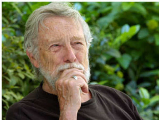
Gary Snyder.

Od wielu lat podkreśla znaczenie przyrody w życiu człowieka. W swoich utworach szczególną uwagę zwraca na zagrożenia ekologiczne. Związany jest z filozofią ekobuddyzmu – często można spotkać się z nazywaniem go mianem „senatora dzikiej natury”. Jest zdobywcą wielu prestiżowych wyróżnień literackich – nagrody Pulitzera, nagrody Amerykańskiej Akademii Sztuki i Literatury, nagrody im. Wallace’a Stevensa.