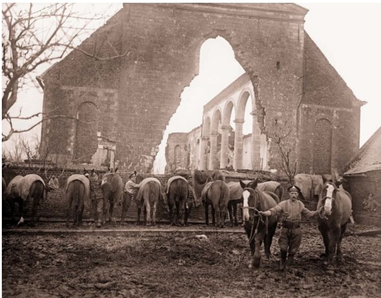
Konie zakwaterowane pod gołym niebem, armia brytyjska, 1918. nr katalogowy Q8446