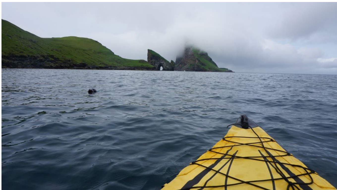
W trasie na Północy.