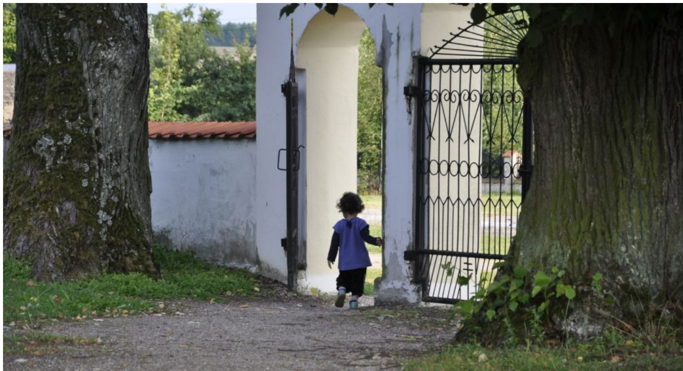
Wejście na teren cerkwi w Łosince.