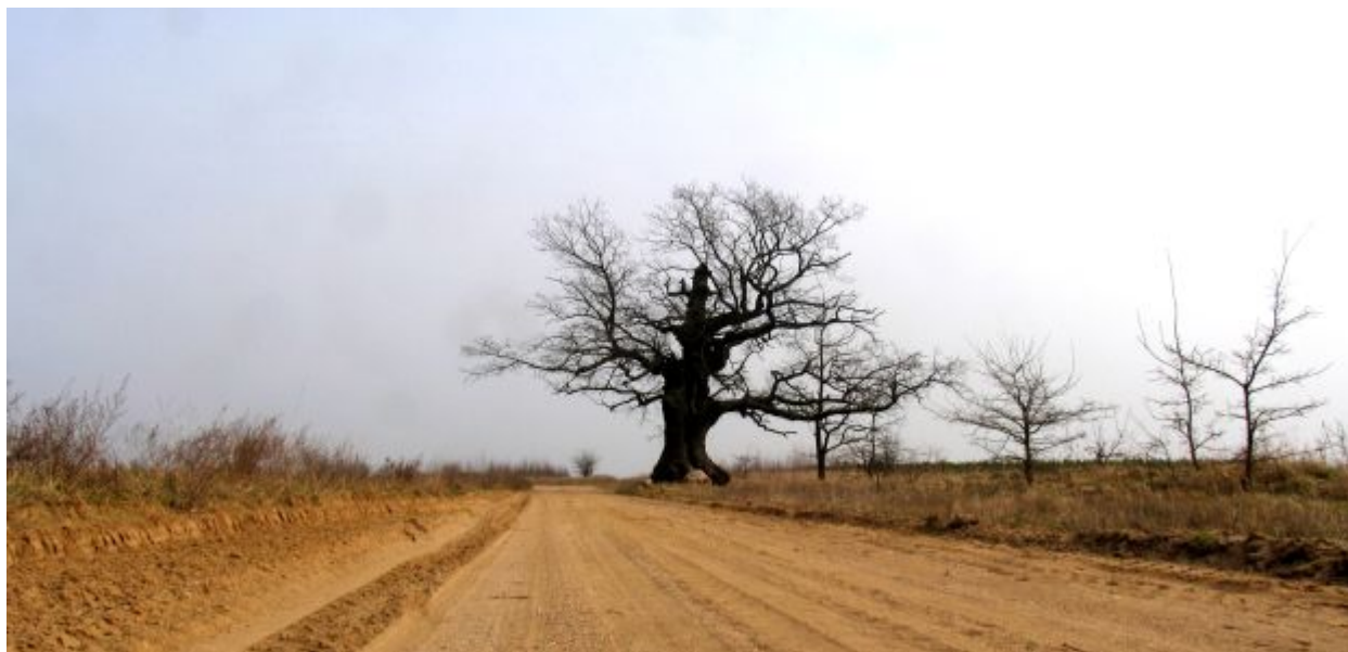
Puszcza Białowieska.

szybko. Z południa napływała ludność pochodzenia ukraińskiego, a z północnego wschodu białoruskiego. Kiedy w roku 1569 powstała Rzeczpospolita Obojga Narodów, Podlasie weszło w skład Korony, a Puszcza Białowieska pozostała w Wielkim Księstwie Litewskim. Nowe osadnictwo dotarło do samych jej granic w XVII w. Na północy puszczy, w 1638 roku rudnik mazowiecki Tomasz Wydra-Polkowski dał początek miasteczku Narewka. Wówczas też powstały kolejne wsie osockie do pilnowania puszczy i pracy w niej (m.in. Orzeszkowo, Dubiny). Potop szwedzki i kolejne wojny wstrzymały rozwój osadnictwa i było ono ponownie kontynuowane dopiero w drugiej połowie XVIII w. Wówczas Puszcza Bielska ostatecznie zniknęła z powierzchni ziemi, a jedyną jej pozostałością jest przyłączona dzisiaj do Białowieskiej Puszcza Ładzka. Szczególną atrakcją jest rosnący w pobliżu tej puszczy olbrzymi, samotny dąb.