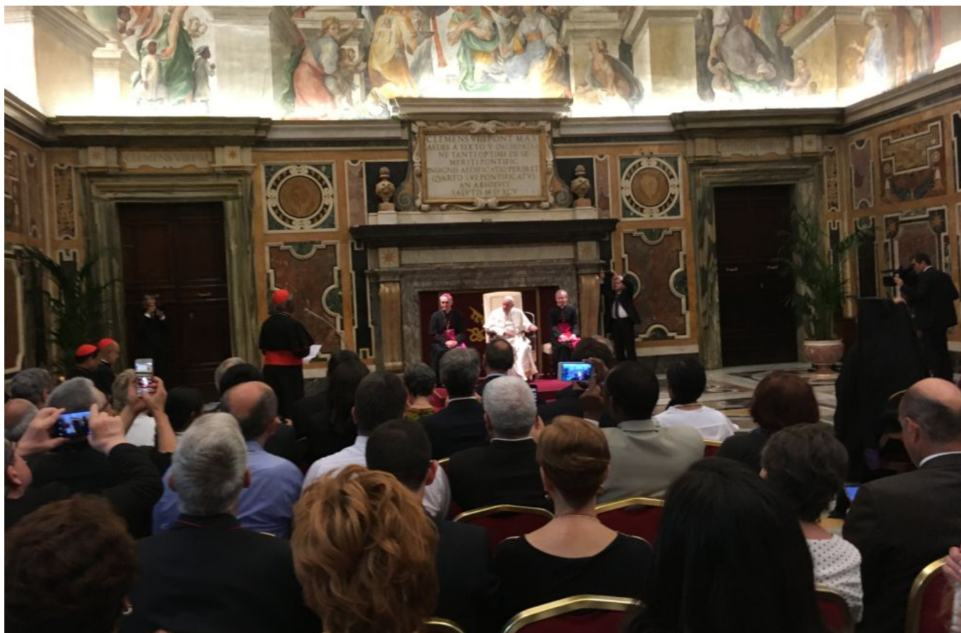
Spotkanie z papieżem Franciszkiem.

O tym jak sprostać tym wymaganiom mówiło wielu uczestników konferencji, w tym jej gospodarz, tj. Dykasteria ds. Integralnego Rozwoju Człowieka. Jej przedstawiciele zapowiedzieli już swój udział w najbliższych międzynarodowych szczytach poświęconych klimatowi (GCAS, COP24), a także globalnym finansom (coroczne spotkanie Banku Światowego i Międzynarodowego Funduszu Walutowego, Bali, 2018). Stolica Apostolska chce także aktywnie kształtować dalszą debatę o ochronie klimatu m.in. podczas nadchodzących synodów poświęconych Amazonii (Watykan, 2019).