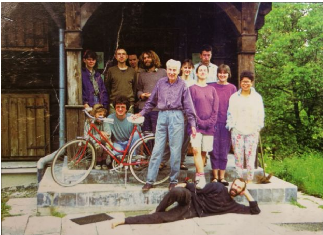
Arne Naess przed Domkiem nad Zaporą (Bielsko-Biała), siedzibą Stowarzyszenia Pracownia na rzecz Wszystkich Istot, 1992 r.